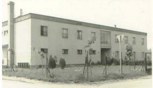
Az óvoda 1979-ben.