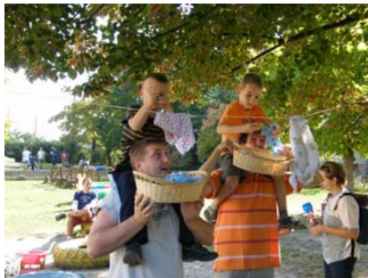
Közös játék a Családi sportnapon