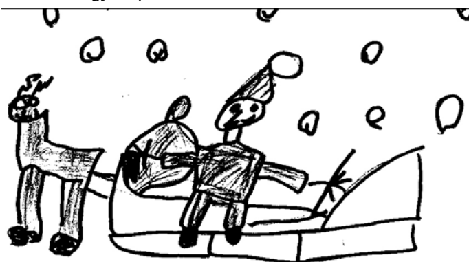
Itt a Mikulás.... Pál Szabolcs rajza (Mackó csoport)

Miután bejött a Mikulás, néhány gyerek örömmel szaladt hozzá, már az ajtóban üdvözölték, alig akarták beljebb engedni, annyira magyaráztak neki. De végül megmutatták neki, hova is ülhet. A Mikulás kedvesen köszöntötte a Cica csoportos gyerekeket, viccelődött is velük, amit nagyon élveztek a gyerekek. Majd jött az, amit a Mikulás sosem akar hallani, ki is volt rossz, a gyerekek maguktól kezdték el mondani (persze, hogy ki volt jó, az eszükbe sem jutott). Mielőtt nagyon belemelegedtek volna a rosszaságok felsorolásába javasoltam, hogy inkább örvendeztessük meg a Mikulást egy szép dalocskával. Akinek volt kedve egy szép verset is mondhatott.